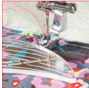
Функция линейной стежки