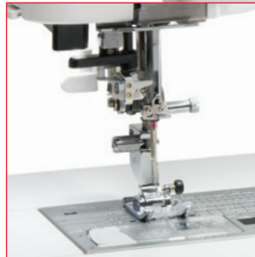
Заправка нити в иглу одним касанием