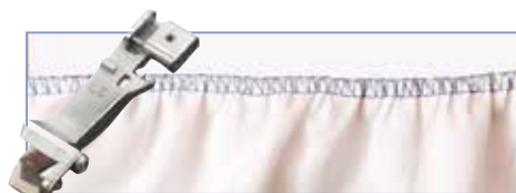
Лапка для присбаривания