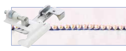
Лапка для пришивания бисера и пайеток