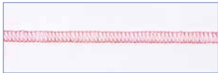
Плоский 2-ниточный оверлок (только для 5100D)