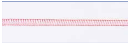
Плоский 3-ниточный оверлок