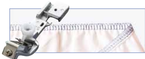
Лапка для пристрачивания тесьмы (резинки)