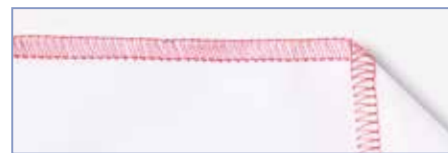
Широкий 3-ниточный оверлок