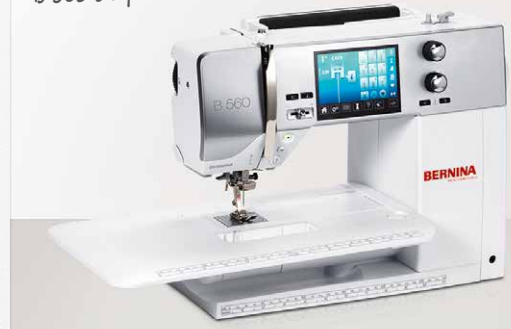
B 560 с приставной столик

Новые модели BERNINA 580 и B 560 восхитят вас своим простым, классическим дизайном. Инженеры компании BERNINA убеждены, что элегантная форма машины должна обязательно сочетаться с ее исключительной функциональностью. Современная эстетика плюс самые современные технологии для шитья, вышивания и квилтинга – вот составные части дизайна модели BERNINA 580 и B 560.